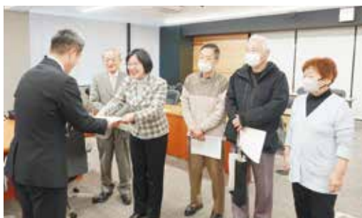
12月12日 アンケートの声を 京都市に届け懇談

2020年12月以降3回の路線縮小や減便が行われ、市民から困るとの声をアンケートでお聞きしました。京都市は、市民の声を広く聞いて京阪バスに届け協議すること、最終的には市バスの復活を含め公共交通の充実に責任を果たすよう求めました。