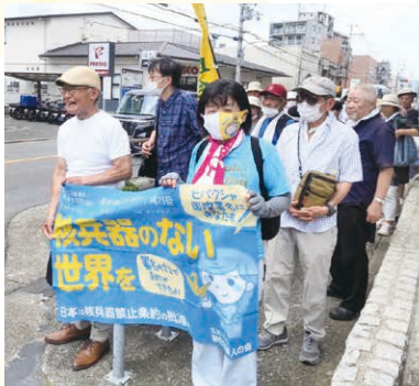
平和行進、市内網の目(昨年7月5日)

日本の国是である非核三原則の見直しの動きも重大です。全会一致の国会決議で「堅持する」としてきた国是を一内閣の判断で変更することは許されません。