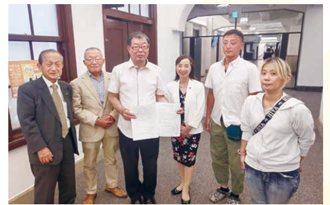
京商連のみなさんが、消費税減税とインボイス廃止の申し入れ

トヨタ自動車1社で、最近の11年間に合計9603億円もの研究開発減税を受け、賃上げ減税は440億円です。大企業優遇の不公平税制にこそメスを入れるべきです。