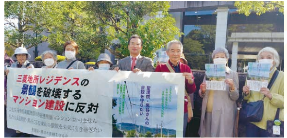
景観を壊す聖護院門跡前マンションの建築確認取り消しを求める裁判(2025年 京都地方裁判所前にて)

今回の「世界遺産保護条例」の提案は、京都における開発に抗した数々の住民運動の経験、私も参加した世界遺産センター・パリ本部での直談判（2017年）、そして、国内外の文化遺産保護の実践から深く学ぶなかで打ち出したものです。残念ながら否決となったものの、反対した議員からも「文化財保護法や風致地区条例などで配慮できていないことがある」「経済性ばかりが優先されているのか」と部分的には共感するご意見も寄せられ建設的な議論となりました。新しい市長のもと加速される規制緩和とホテル・民泊の乱立、ミニ東京をめざした開発に抗して、京都らしさと住環境を守り抜くため、攻勢的な取組を進める大切な一歩となりました。一層がんばります。