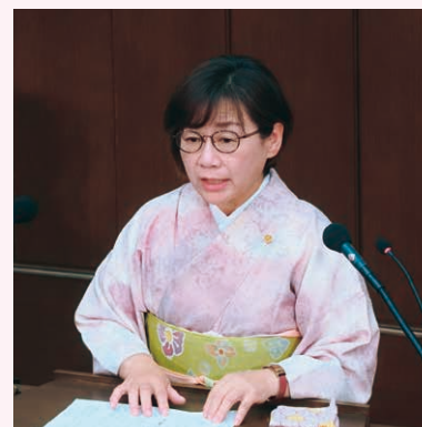
代表質問では必ず、介護保険の問題を質疑しています

私は市会に送っていただく前は、保健師（看護師）として、医療や介護の相談員をしていました。介護保険が始まる直前で、ケアマネジャーの勉強をしていて、この制度は政府の負担を抑え、どんどん利用料や保険料が上がる仕組みとなっており、良いものにしないといけないという思いを募らせ、市会議員に立候補する決意をしました。介護現場の声、実態を議会に届けて、改善を求めてきました