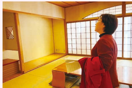
廃止予定のウイングス京都の和室を視察

「子どもの寝顔しか見てない」と辞めていった京都市の女性課長のことを忘れられません。男性も女性も働く環境を改善し、育児や家事を男性も同じように担うようにすることが大事です。そんな取り組みを政治や行政、市民も一緒に進めていくための大事な拠点となるウイングス京都の面積を縮小する計画が進んでいます。議会で繰り返し取り上げ、改善を求めています。女性の代表としてもこれからも頑張ります