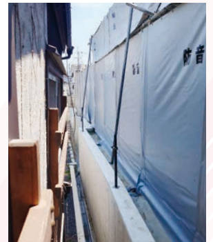
革堂前之町・山王町マンション開発（京阪電鉄不動産とJR九州）

3メートル盛り土の上に5階建てマンション（千本通り側7階建て計3棟）に立体型機械式駐車場は、北側住宅の日照遮断、周囲への圧迫感と騒音、交通量の増加が必至。市長は住民が住み続けられるための実効性ある対策を行うべきです。