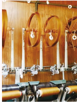
西陣織の工程を守る対策を

市内事業者の声をもとにインボイス廃止、市独自の中小事業者支援を求め、西陣織物織機メンテナンスと織物家内労働者の工賃引上げで産地守れと追及しました。