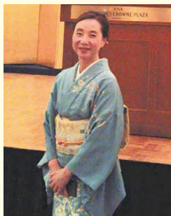
上京区民新春の集い

みなさんの温かいご支援で市会議員6期目、最後の年を迎えることができたことに深く感謝いたします。年始の会で、「株価高、なんの恩恵もない」の声を聴きます。市民の願いに応える政治の転換がまったなしです。 ウラ金や国保税逃れと無縁な政治の実現に力を尽くします。 来春には府政をチェックする立場で憲法を活かし、いのちと暮らし、平和を守る運動をみなさんと一緒にすすめていけるよう頑張りたいと思います。