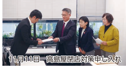
11月11日 高島屋閉店対策申し入れ

市は現在、市内中心部の学校跡地は一般の跡地と区別し、活用については地域自治会・住民の声を反映するとしています。竹の里小・西陵中学校も学校跡地として地域の意見を反映するように求めました。 《子どもから高齢者までが憩える場所を》 川西市宮住宅の跡地は民間に売却せず「団地公園ぐらゐ広い公園に」誰もが利用しや