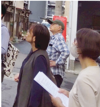
細街路に面した「民泊」について 住民の方から要望をうかがう。