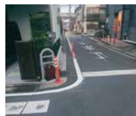
地域からは歓迎の声が出ています

通学路でもある高辻通の千本一七本松間の歩道の白線が薄れ、地域から改善の音が挙がっており、土木みどり事務所何度か掛け合った結果、白線が更新され、歩道の安全性が向上しました。引き続き声をお寄せください。