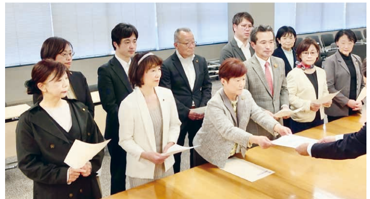
受験生をねらう痴漢の防止、被害救済申し入れ