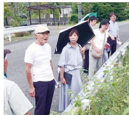
リニア新幹線トンネル工事で水枯れ・地盤沈下が起きた岐阜県瑞浪市大湫町を視察