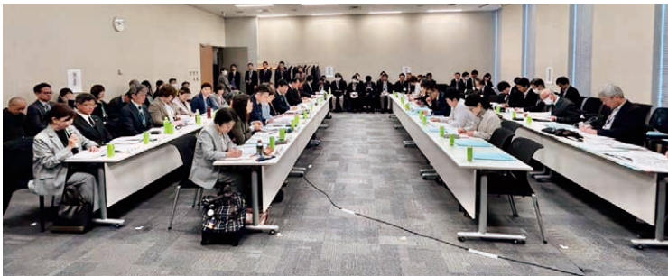
党政令市議・国会議員団懇談に参加

主な内容は、給食センター整備予定地の浸水リスク、避難所の食事提供における学校給食施設の活用、区役所に女性相談窓口の設置を、北陸新幹線延伸計画は中止、詳細なハザードマップの作成・住民の避難経路確保支援を、市役所・区役所のトイレに生理用品・授乳室に調乳用温水器の設置を、有料ゴミ袋の値下げを、利用しやすい生活保護制度を、核兵器禁止条約批准をなどです。質疑を通し、困難な問題を抱える女性支援に対する国からの補助金を新たに確保することができました。