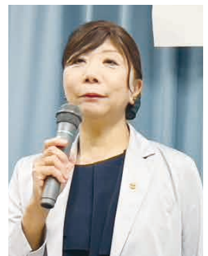
大規模給食センター計画の現状報告