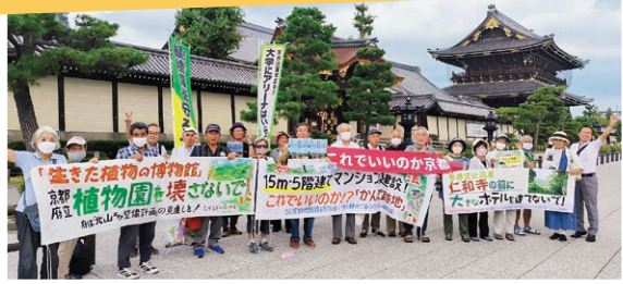
「これでいいのか京都」の宣伝に参加（9月30日）

植物園を守ろう！ 府立大学にアリーナはいらない！ 住環境を壊す巨大マンションはNO！