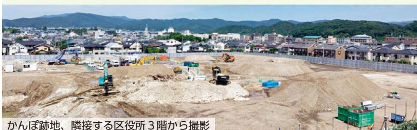
かんぽ跡地、隣接する区役所3階から撮影

本会議で採択に付されたときの討論を紹介しています。ぜひ、ご覧ください。自民、公明のみならず、京都、国民、そして維新の議員までもが市長言いなりに請願に反対しました。選挙の前も後もブレずに住民の立場でがんばりぬくのが日本共産党。引き続き力を尽くします。