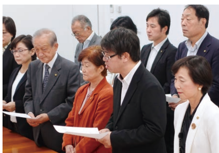
議員団を代表して主旨説明を行いました

10月26日に事業者に対する申し入れを行いました。特にインボイス制度は、売上1000万円以下の事業者を直撃しています。領収書を求められる際に「インボイス番号がない」「取引先から値引きを迫られる」などの事態が進行しています。廃止へ追い込むため引き続き声を上げ続けます。