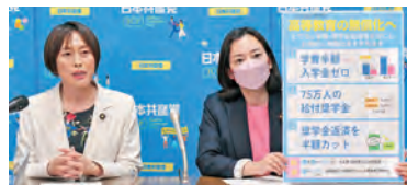
6月5日、政策発表する 田村智子政策委員長(左)と吉良よし子参院議員

異常な高学費、合計10兆円にもぼる奨学金返済の負担は、私たちの暮らしを押しつぶし、経済の足かせにもなっています。お金の心配なく学ぶことは、憲法に定められた権利です。日本共産党は、緊急に学費・奨学金返済を半額にする提言を発表しました。