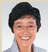
参議院議員 倉林 明子