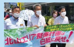
北山エリア整備計画見直し求めて府庁包囲宣伝

北陸新幹線地下延伸計画や植物園を壊す北山エリア整備計画など、「ムダと環境破壊の大型開発を許すな！」と立ち上がった住民のみなさんと連帯して、府議会で繰り返し追及してきました。