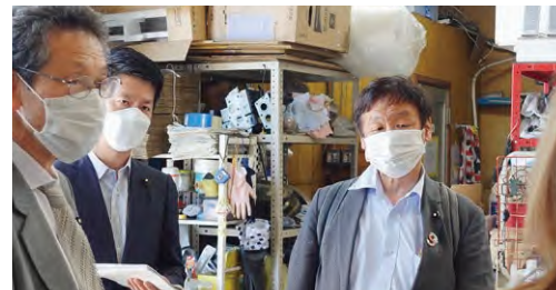
町工場で実態を聞き取り調査

6月議会の代表質問では、コロナ禍に加えて物価高騰で深刻な事態になっている中小業者の実態調査をふまえて、 京都府の直接支援を求めました。 また、 コロナ禍と物価高騰から中小業者の営業を守る最良の政策は消費税減税だと、議会でも、街頭でも訴え続けています。