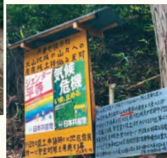
対策を求める党掲示板