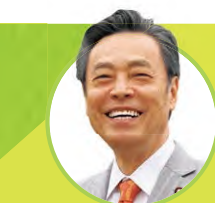
衆議院議員・ 日本共産党国会対策委員長