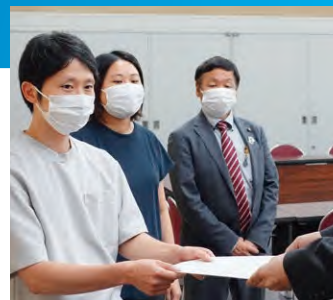
京都府に対し、苦しむ青年・学生への支援を申し入れ

コロナ禍で苦しむ青年・学生の苦難軽減のための、食料提供プロジェクト・生活相談会に参加し、そこで寄せられた切実な声をもとに、民青同盟など青年・学生団体のみなさんと一緒に、学生への支援を求めて京都府へ要望するとともに、議会で何度も取り上げてきました。その結果、 大学・専門学校が実施する食料品や日用品の提供への全額支援が実現しました。