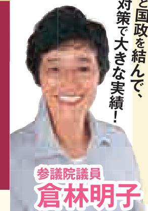
参議院議員 倉林明子