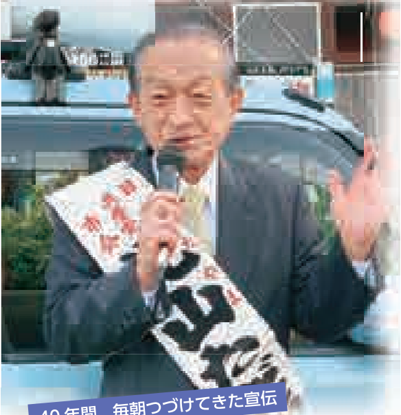
40年間、毎朝つづけてきた宣伝