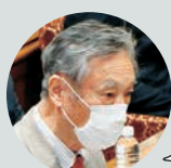
ことくた恵二 日本共産党 衆議院議員