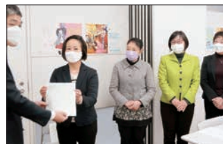
鉄道会社への申し入れ

●「生理用品をトイレに」 —リプロダクティブ・ヘルス & ライツの課題を議会で とりあげました