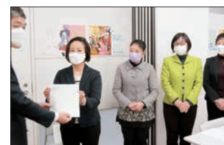
鉄道会社への申し入れ

●「生理用品をトイレに」リプロダクティブ・ヘルス＆ライツの課題を議会でとりあげました