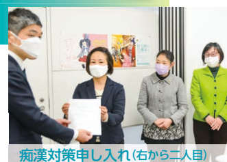
痴漢対策申し入れ(右から二人目)

痴漢実態アンケート調査実施、鉄道会社に対策を申し入れ、 駅のホームでの「痴漢は犯罪」のテロップの表示を実現 しました。また、「 生理の貧困 」などを女性の人権の課題として議会で取り上げ、トイレに生理用品を置く小中学校が広がっています。