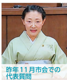
昨年11月市会での代表質問

京都市として、廃材を資源化してコスト削減ができる 小型バイオマス発電 による林業支援を行うこと、給食食材の地産地消をすすめることで 休耕地の活用と農業支援 を行うことを提案しました。