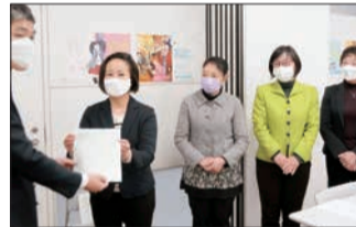
鉄道会社への申し入れ

●「生理用品をトイレに」 —リプロダクティブ・ヘルス & ライツの課題を議会で とりあげました