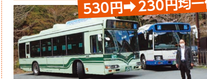
530円→230円均一化 議会で取り上げるとともに交通局への要望運動を続けてきた成果が実りました。