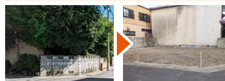
「木が生い茂り崩れそうな家がある」と相談が。市に働きかけ、解体工事につなげました。