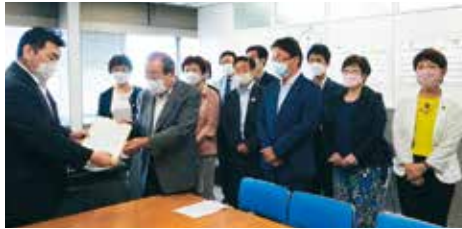
命となりわい守る 緊急申し入れ

コロナ禍は、医療や公衆衛生体制が極めて脆弱であることを浮き彫りにしました。私は、宇多野病院等を名指してベッド削減を迫る動きにきっぱり反対し、地域医療を守れと迫ってきました。無料PCR検査を広げ、高齢者やリスクのある人の入院を保障する医療体制の拡充・保健所増設を求めています。