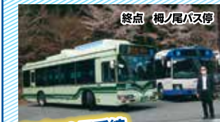
市バス8号系統、 均一運賃実現、バス停新設

市バス8号系統の均一運賃化実現(最大530円→230円に値下げ)。バス停も新設されました。長年地元と利用者の声を議会で取り上げ、とうとう実現しました。