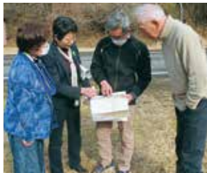
新幹線計画ルート上の京北住民のみなさんと現場調査

美山・京北・京都市内を大深度(地下40メートル以下)巨大トンネルで縦断する無謀な計画に対し、地域ぐるみで反対の声が広がっています。2023年工事着工を狙った当初計画に待ったをかけています。新幹線より、防災対策の強化を!新幹線より、子育て応援!命を守る府政を!と頑張っています。