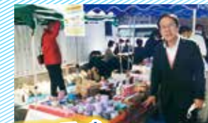
生活に困った 食材提供プロジェクト参加

コロナ等で「バイトや仕事が無くなった」皆さんがいます。市民団体の皆さんが実施した「食材提供プロジェクト」に参加し、相談にのってきました。