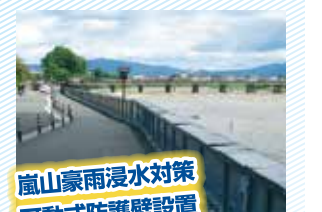
嵐山豪雨浸水対策 可動式防護壁設置

嵐山付近は豪雨災害で浸水する被害が繰り返されてきました。市議会代表質問で取り上げ、関係者の努力が実り、嵐山渡月橋北側に可動式防護壁が新設されました。