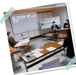
▲明石・大山崎から学ぶ企画 「子育てしやすい町をみんなの手で」(2022年12月15日)

明石市では高校卒まで医療費無料。大山崎町は16ヶ月水道料金基本料無料、自校式中学校給食スタートと同時に無償化へ。明石でも大山崎でも、くらしと子育て応援で人口増・税収増と「好循環」が生まれ、持続可能な財政運営が行われています。