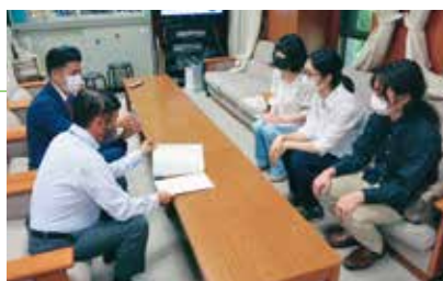
学生団体のみなさんの申し入れと意見交換

コロナ禍で困窮する学生への「食材提供プロジェクト」が取り組まれ、府議団も相談員として参加。学費無償化をめざす学生団体のみなさんとも連帯し、食材支援への補助など京都府としては初の大学・学生支援策を実現させました。