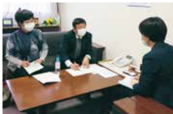
新型コロナ発生直後から医療・介護現場で聞き取り

2020年以来、十数回の街頭調査活動をはじめ、医療関係者などさまざまな団体・個人を訪問し、要望を伺ってきました。そうした声を力にして、15回の申し入れを行い、入院待機ステーションに高齢者も入院できるよう求めるなど、新型コロナ対策を一步步つ前進させてきました。