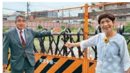
特養ホーム建設予定地の元府立中小企業指導所跡地にて