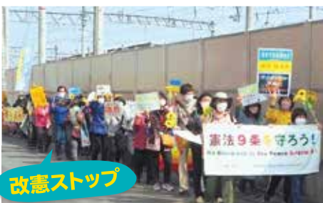
第18回 西京ピースウォーク、「憲法9条を守ろう」とアピール

自衛隊駐屯地のある西京から、「戦争する国への逆戻りは許さない」「自衛隊員を海外の戦争に送るな!」と声をあげましょう。