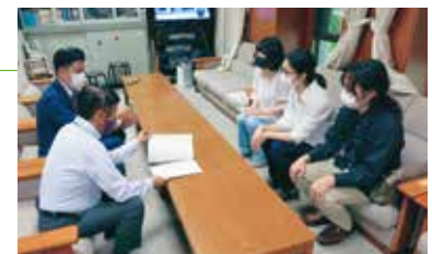
学生団体のみなさんの申し入れと意見交換

コロナ禍で困窮する学生への「食材提供プロジェクト」が取り組まれ、府議団も相談員として参加。学費無償化をめざす学生団体のみなさんとも連帯し、食材支援への補助など京都府としては初の大学・学生支援策を実現させました。