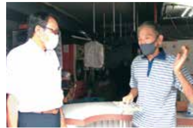
商店街で要望をうかがう

コロナ禍の経験は、国待ちではいのちを守れないことを明らかにしました。私は保健所、商店街の現場を訪ね声をあつめ府に要請してきました。物価高騰やコロナ禍で厳しさを増す暮らしや営業の現場で何が求められているか、保健所や医療機関の体制強化など、府政に声をあげ実現します。