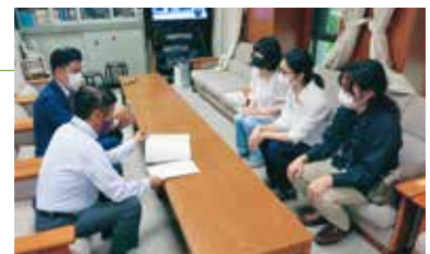
学生団体のみなさんの申し入れと意見交換

コロナ禍で困窮する学生への「食材提供プロジェクト」が取り組まれ、府議団も相談員として参加。学費無償化をめざす学生団体のみなさんと連帯し、食材支援への補助など京都府としては初の大学・学生支援策を実現させました。