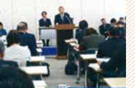
後期高齢者医療保険広域連 合議会で発言