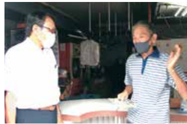
商店街で要望をうかがう

コロナ禍の経験は、国待ちではないのちを守れないことを明らかにしました。私は保健所、商店街の現場を訪ね声をあつめ府に要請してきました。物価高騰やコロナ禍で厳しさを増す暮らしや営業の現場で何が求められているか、保健所や医療機関の体制強化など、府政に声をあげ実現します。