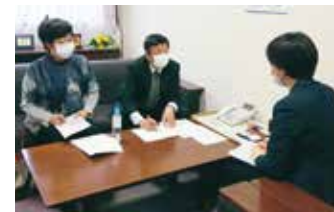
新型コロナ発生直後から医療・介護現場で聞き取り

2020年以来、十数回の街頭調査活動をはじめ、医療関係者などさまざまな団体・個人を訪問し、要望を伺ってきました。そうした声を力にして、15回の申し入れを行い、入院待機ステーションに高齢者も入院できるように求めるなど、新型コロナ対策を一つずつ前進させてきました。