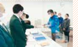
市民から交通局への申し入れ に同行