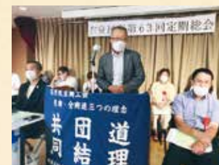
民主商工会総会であいさつ

物価高騰対策として最も効果があるのは消費税減税です。京都市として国に対し、消費税減税、零細事業者を廃業に追い込むインボイス制度の実施は中止を求めます。