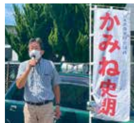
街頭でコロナ対策を訴え

私は、府議時代に骨髄バンクの実現に貢献し、減らされた保健所の復活や宇多野病院など国