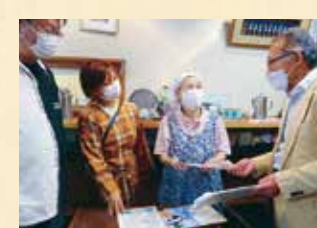
業者のみなさんから聞きとり