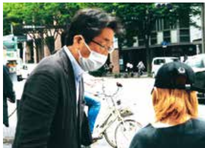
ハローワーク前で 生活アンケート調査

私は、府議時代に市民とともに運動し、公立私立の高校授業料の無償化や子どもの医療費月1500円への負担軽減を実現しました。今後、中学卒業までの医療費無料化、学校給食費の無償化、全員制の中学校給食など子育て要求を実現します。