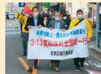
3・13 減税反対統一行動