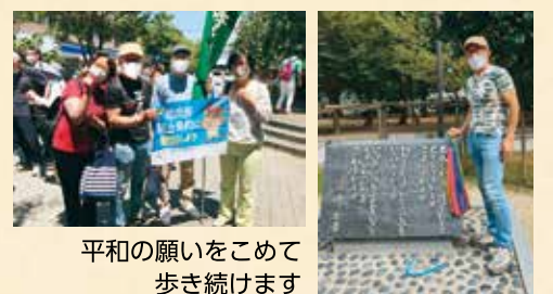
平和の願いをこめて 歩き続けます

1975年、20歳の時に初めて原水爆禁止世界大会に参加して以来平和運動に取り組んできました。ロシアのウクライナ侵攻を口実にした大軍拡は許せません。武力で平和は守れません。憲法9条を活かした外交努力こそ必要です!