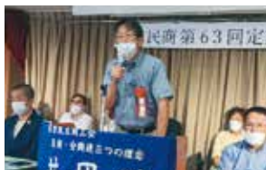
右京民商総会で中小企業 支援を訴え

私は、府議時代に高すぎる国民健康保険料や介護保険料の値下げ、老人医療無料化の充実を求めてきました。物価高騰から市民生活を守るため、消費税を5%に引下げ、年金カットや医療費値上げをやめさせ、府独自の医療・介護の負担軽減を求めます。