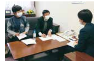
新型コロナ発生直後から医療・介護現場で聞き取り

2020年以來、十数回の街頭調査活動をはじめ、医療関係者などさまざまな団体・個人を訪問し、要望を伺ってきました。そうした声を力にして、15回の申し入れを行い、入院待機ステーションに高齢者も入院できるように求めるなど、新型コロナ対策を一步步前進させてきました。