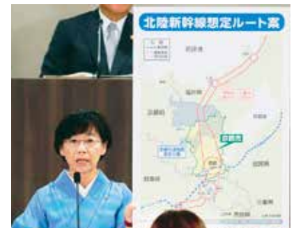
北陸新幹線延伸ルート案のパネルを掲げて代表質問

40m地下を掘り進むトンネル新幹線は、環境破壊と莫大な借金を後世に残すこととなります。絶対にストップをかけるため、住民の皆さんと力を合わせ頑張ります。