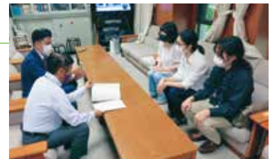
学生団体のみなさんの申し入れと意見交換

コロナ禍で困窮する学生への「食材提供プロジェクト」が取り組み、府議団も相談員として参加。学費無償化をめざす学生団体のみなさんとも連帯し、食材支援への補助など京都府としては初の大学・学生支援策を実現させました。