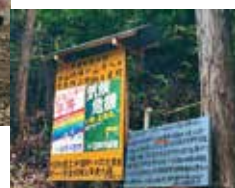
対策を求める党掲示板