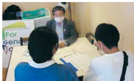
食料提供プロジェクトで生活相談