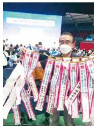
ヒロシマデー集会(6日)にて