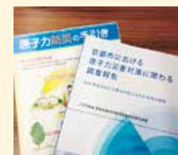
脱炭素をめざして原発ゼロを

2050年CO2ゼロをめざして待ったなし。京都市の2030年目標46%削減の引き上げを求めて文化環境委員会で追及。政府の「原発を最大限活用」「早期に再稼働を」の動きを厳しく批判し、再生可能エネルギーの大規模活用を提案しています。