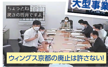
ちよつとね 麗さの答弁ですよ ウイングス京都の廃止は許さない!