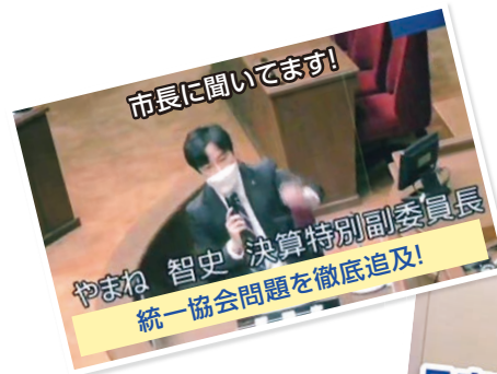
市長に聞いてます!

伏見の地下に巨大トンネルを掘る「北陸新幹線延伸計画」は、ムダな巨大開発の典型です。伏見で暮らす私たちに必要なのは、北陸新幹線や豪華な市役所ではなく、「子どもたちのための全員制中学校給食」「公園整備」「交通不便地域を走る小型循環バス」「敬老乗車証の負担増撤回」「住民が気軽に集まれる公共施設」「伏見区役所や深草支所・醍醐支所の保健所機能復活」ではないでしょうか。税金の使い道を変えれば、もっと住みやすい伏見をつくることができます！