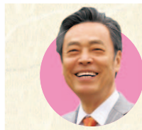
衆議院議員 こくた 恵二