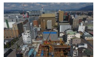
ドローン空撮 松本博