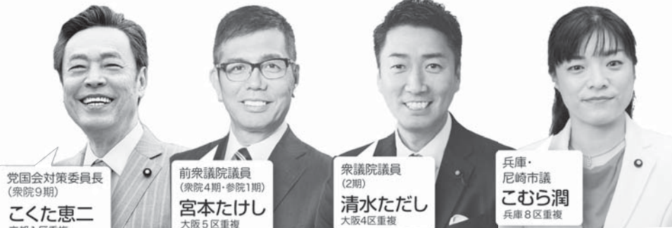
党国会対策委員長 (衆院9期) こくた恵二 京都1区重複