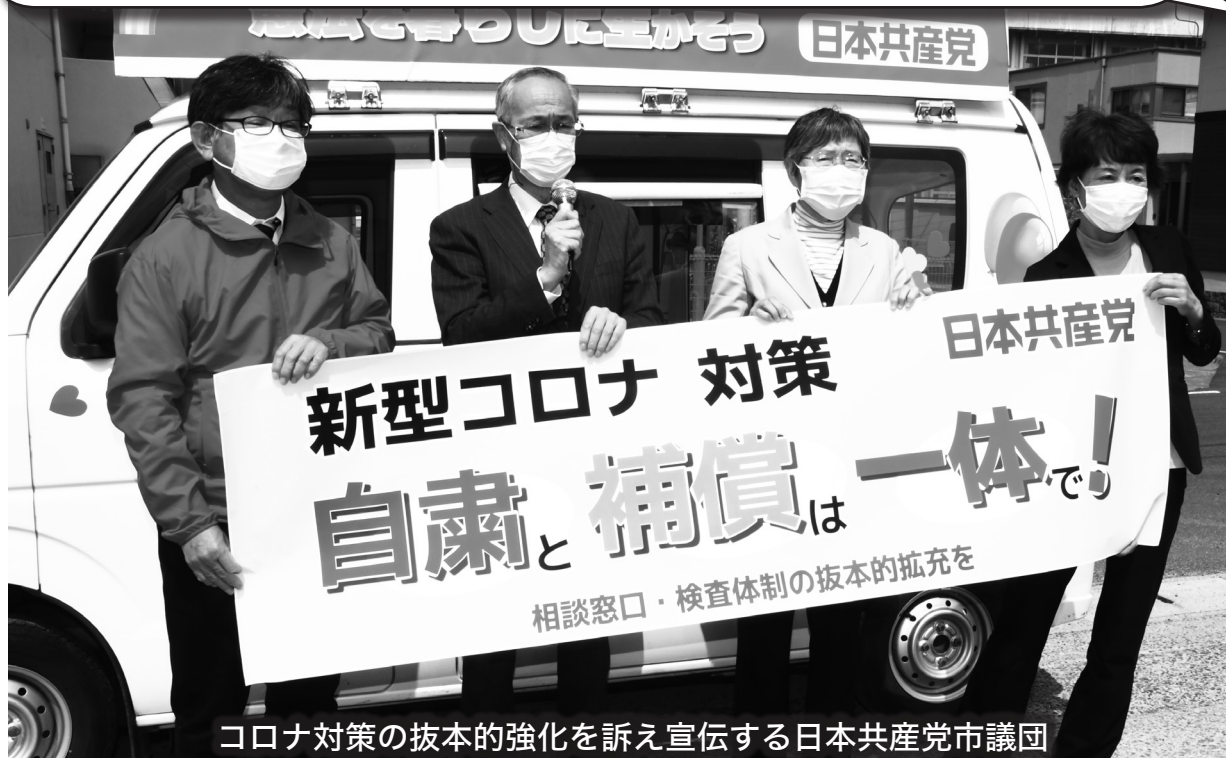
コロナ対策の抜本的強化を訴え宣伝する日本共産党市議団