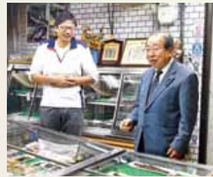
← 商店での聞き取り