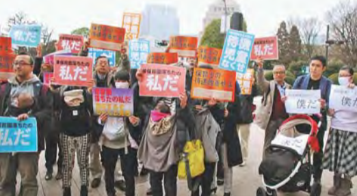
「保育園落ちたの私だ、もっと保育園を」と抗議する人たち =3月5日、国会正門前

大学授業料10年で半額に 給付奨学金を 毎年1150億円の予算を「学費特別補助」として増額し、国公立も私立も段階的に学費を引き下げます。月3万円の給付奨学金制度(70万人分)をつくります。高等教育予算を先進国なみのGDP比1.2%に引きあげれば可能です。