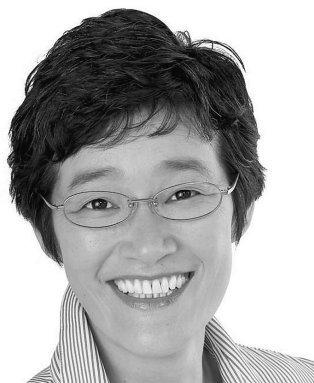
倉林 明子 参議院議員 COP21に参加 原発依存の転換を