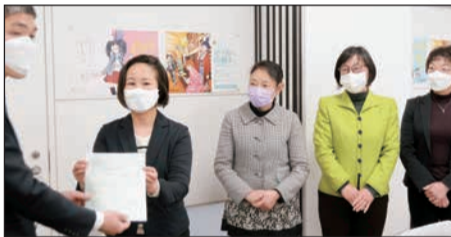
鉄道会社への申し入れ