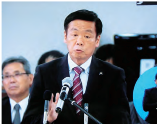
西脇知事に、子どもの貧困対策を求める

子どもの医療費の助成制度の拡充を求め続け、今年度予算で制度改善の検討が始まり、来年度予算で実現の見通し。不十分な公立高校通学費の補助制度の拡充を求め、改善への検討が始まる。