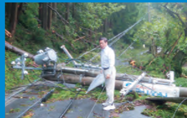
地震、集中豪雨、台風と相次ぐ自然災害の被災地復旧に全力