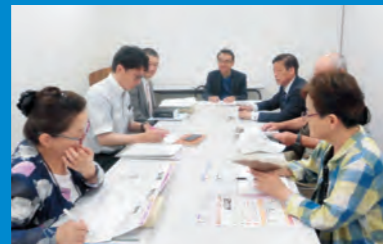
外国人観光客によるバス混雑解消などを求めて、交通局に申し入れ