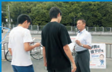
高すぎる学費・返せない奨学金・ブラックバイト改善へ全力