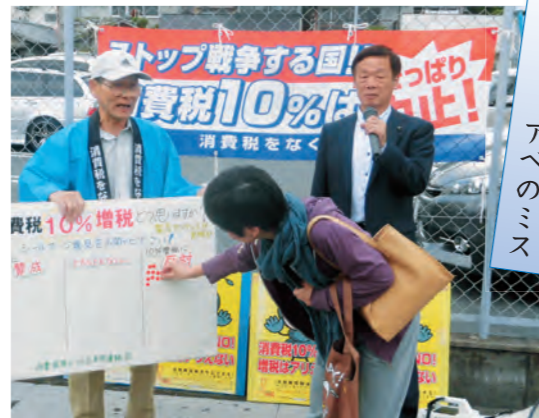
消費税廃止北区連絡会のみなさんと署名宣伝行動

住宅リフォーム助成制度の創設で地元の中小企業の仕事起こしを、大型店の進出を規制し商店リフォーム助成制度の実施で商店街支援をと論戦。暮らしと営業に、深刻な打撃を与える消費税増税にキッパリ反対。