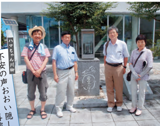
きたかみ原発ゼロネットのみなさんと福島へ

原発事故から7年以上たった福島の今を見てきました。原発事故が起こったら取り返しがつかないことを実感しました。戦争する国づくりをねらう憲法9条改悪を許さず、原発ゼロをめざします。