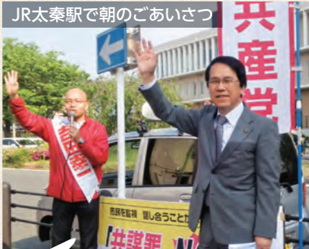
JR太秦駅で朝のごあいさつ

農林業は国土、環境、食料主権を守り国をつくること。市内農林業の振興に尽くす議員です。経済の中心である中小企業振興のため条例制定に取り組んでいます。