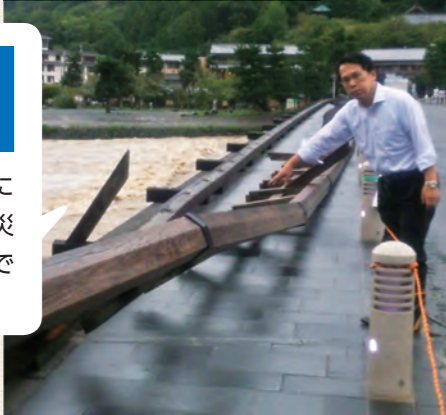
台風で壊れた渡月橋を調査

災害が頻発しています。現場にかけつけ、市民の声を聞き、災害に強い街づくりに取り組んでいます。