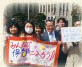
「西京に保育所ふやしてチーム」 のみなさんと