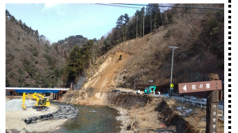
本復旧への工事が進む

昨年の1月、府道京都広河原美山線の土砂崩落で美山町佐々里と芦生の2集落が孤立。この時、監視員の配置や崩落の日の電源車の手配など共産党府会議員ががんばらせていただきました。