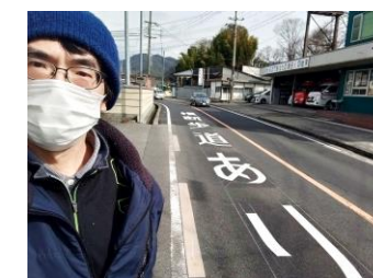
横断歩道を知らせる表示が実現