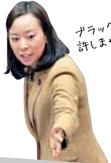
ブラックは許しません!