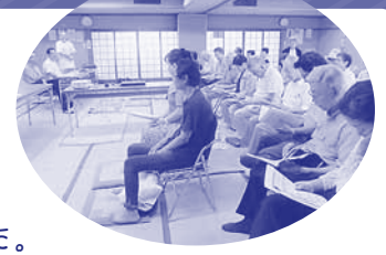
▲北区鳳徳学区のDVD見る集い

「国会議員って何してるか、いままで知りませんでした。オーラが違いますね。」 — 4児の子育てママ