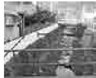
安祥寺川護岸コンクリート補強