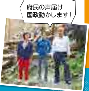
府民の声届け 国政動かします!

毘沙門から大文字に向かう登山道、国有林の大規模崩壊で道が寸断。現場に足を運び、国の近畿中国森林管理局に申し入れ、直ちに予算確保と復旧・整備が実現しました。