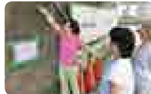
◀山科ブロック塀調査