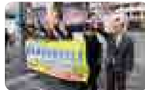
◀市役所前での敬老乗車証宣伝