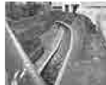
四ノ宮川「すじかいはいし」下流

府議会代表質問(3年前)で台風18号災害・山科区の浸水被害を取り上げ、「雨が降るたびに不安!」の被災者の声を紹介し、早期改修を要望。知事は管理責任を認め、河川整備計画の策定を約束。四ノ宮川は川床を掘り下げ、川の断面を大幅に広げる計画、安祥寺川はJRの線路下にバイパストンネル(導水管)を通し、水位計が設置されます。 昨年4月から工事に着工。「一緒に足を運び、実現してくれた!」と地域から喜ばれています。