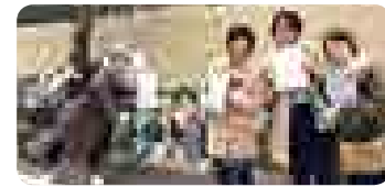
▲中学校給食の宣伝署名活動