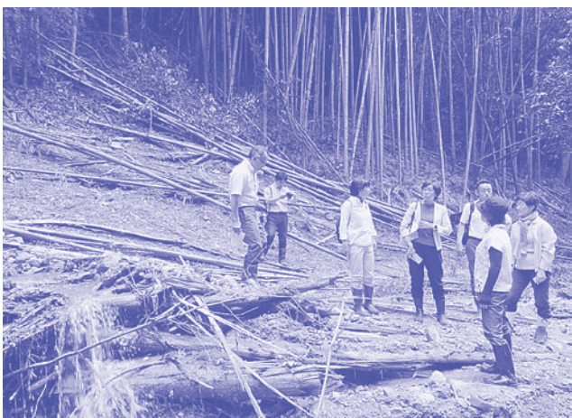
伏見区・小栗栖宮山地域の土砂崩れ現場