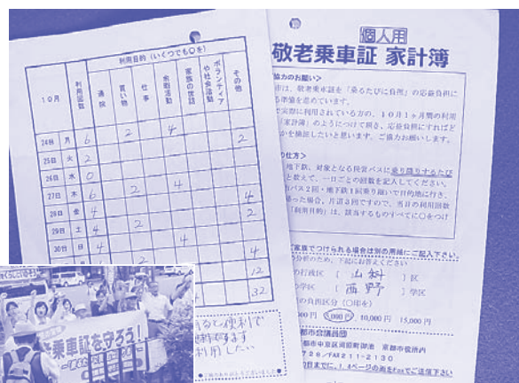
敬老乗車証「家計簿調査」