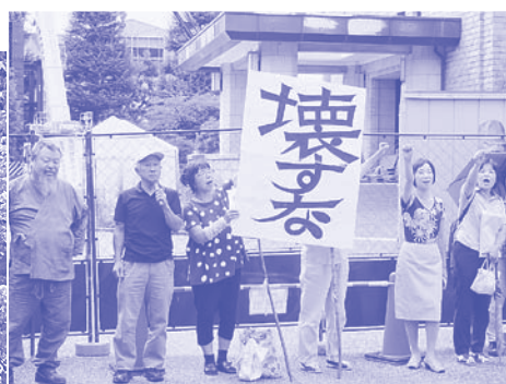
「モニュメント壊すな」宣伝