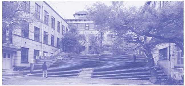
元清水小学校（東山）跡地はホテルに

法の活用」「市有地・民有地の産業用地としての積極的な活用」を明記。京都駅周辺の162haもの地域を「都市再生緊急整備地域」に指定し、企業が自由に開発提案できるように規制緩和。さらに、企業が「市有地・民有地」を全面活用できるようにする方針のもと