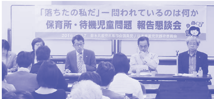
党議員団主催 保育所・待機児童問題報告懇談会

利条例制定」に向け、「京都子どもネット」が発足し、子どもの実態告発のシンポなどが開かれています。