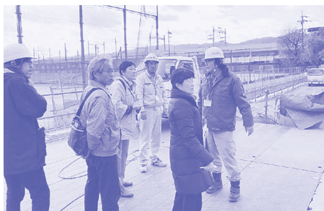
公共事業の現場視察

2015年、党議員団は、公契約条例の制定にむけ様々な団体と懇談を重ね、「提言」を発表。条例がよりよいものになるよう運動と論戦を強めてきました。2015年10月、公契約基本条例が制定されましたが、賃金条項が欠落しており、党議員団は、「賃金条項は、現場労働者の賃上げを確保するとともに、市内業者への発注促進につながるものであり条