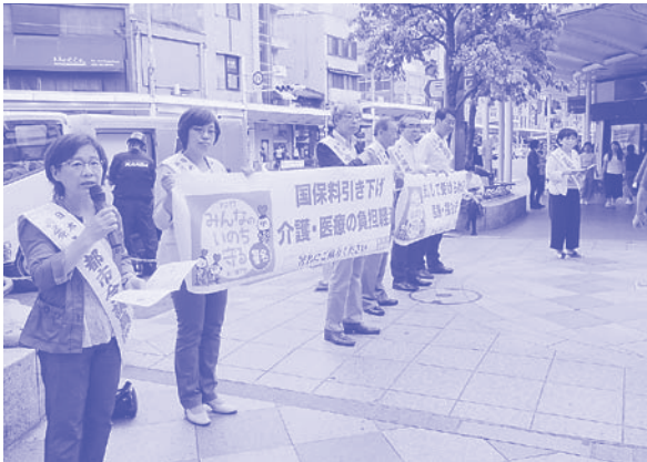
「みんなのいのちを守る署名」行動