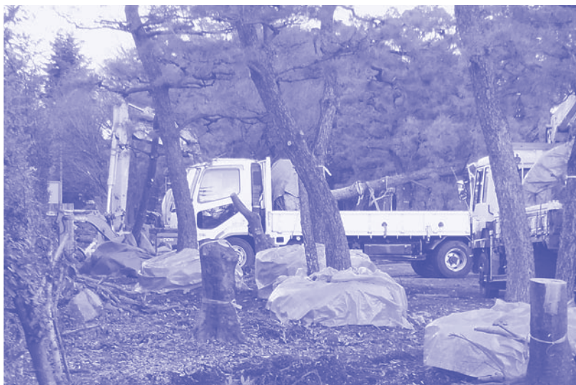
世界遺産・二条城、 松の木の伐採 駐車場建設のための

また、二条城北西にある松の木を伐採して大型バス駐車場建設計画が浮上。近隣住民は「住民の会」を結成し、5000人を超える署名と共に「撤回求める請願書」が出され、党議員団はその声をもとに議会で論