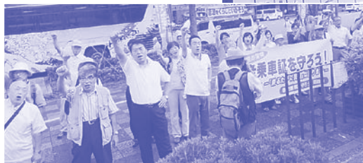
「敬老乗車証を守れ」集会

敬老乗車証制度の改悪方針の提案から5年間にわたって改悪実施を許していません。「守ろう敬老乗車証連絡会」と共同してキャラバン宣伝、集会デモにくり返したりくみみました。「連絡会」は3万7000筆の署名を提出。また、「連絡会」は1ヶ月にわたって「敬老乗車証をどれだけ活用したか 家計簿アンケート」を実施。こうした運動が力となり、議会で党議員団がくり返し取り上げる中で、市長は「応益負担の改悪」には触れず「制度は残す」と答弁。改悪実施に踏み切れない状況を作り出しています。