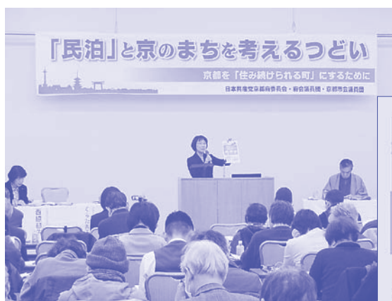
「民泊」と京のまちを考えるつどい (2018年1月27日)