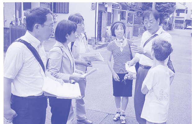
大阪北部地震・伏見区淀地域での調査

また、左京区・北白川仕伏町で起こった2015年台風11号豪雨による土砂崩れ被害（建物全壊など）について、緊急対策を求めました。被災規模が小規模なため国や府の被災者支援制度の適用外となっていることを