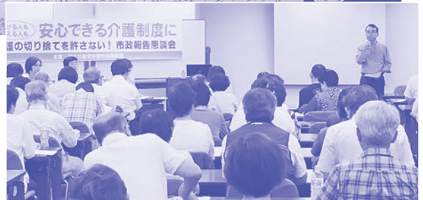
介護保険シンポジウム