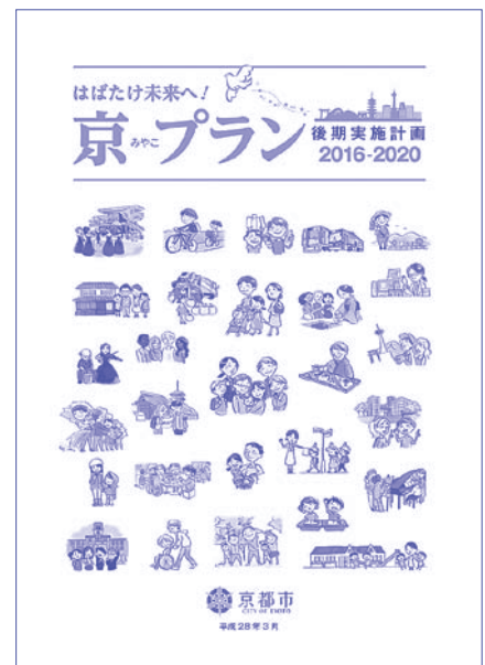
京プラン後期実施計画

企業に儲けの場を提供。③職員削減をさらにすすめ、民泊対応や税務部門の縮小など行政サービスは後退。職員は長時間労働を強いられ、交通局職員の長時間労働による過労自殺という痛ましい事態まで引き起こしています。職員の労働時間は、過労死ラインとされる80時間を超え、100時間の時間外勤務が発生するなど、市職員削減は限界にきています。党議員団は、「京プラン」は市民の暮らしを守るという自治体本来の役割を投げ捨てるものとして厳しく批判。「京プラン」の撤回を強く迫っています。