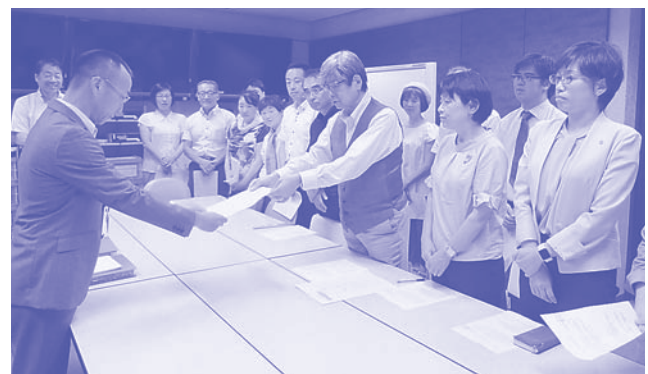
京都市への申し入れ