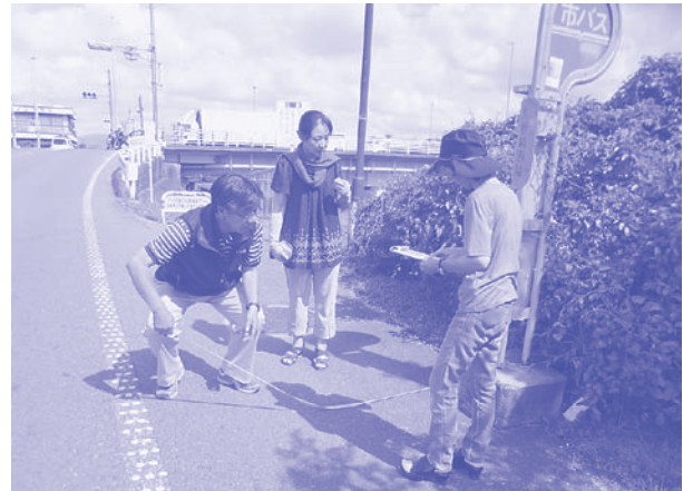
バス待ち環境を調査する党議員

「市バスをもっと通してほしい」との要望を受け議会でくり返し取り上げてきました。伏見区など市バスの増便、新系統実現。ベンチや上屋などバス待ち環境の改善。市内均一区間拡大など市バスの利便性の向上、民間バスの施設改善補助制度の実現、地下鉄烏丸線3駅で転落防止柵を実現しました。2017年3月、阪急西院・嵐電西院駅を結ぶ通路と同時にエレベーターの供用が実現。「地下埋設物が多い」「駅構造上困難」といわれながら20年。「住みよい西院学区をつくる会」の皆さんと、署名に取り組むなど粘り強い運動と議会での論戦が実ったものです。