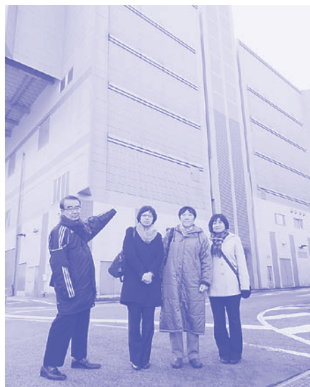
焼却灰溶融施設を調査する党議員

焼却灰溶融施設プラント設備工事について、計画段階から反対を表明してきました。○灰溶融炉処理は技術的に未完成であること○全国の自治体ではコスト高により運転中止が相次いでいること○総事業費175億円、年間運転経費20億円という巨額の無駄遣いであることを指摘し中止を求めています。しかし、強引に工事を推し進めようとした京都市と住友重工の計画は破綻し、最終的に154億円の和解金を住友重工が支払うことになりました。