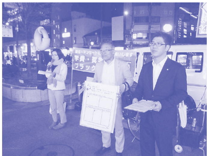
LDA-KYOTOと共に宣伝する党議員

LDA-KYOTO（生きやすい京都をつくる全世代行動）の皆さんと一緒にブラック企業・ブラックバイトの実態調査を実施、市に対策を求めました。市長も「ブラックバイト・ブラック企業根絶」を表明。京都府・京都市・労働局の三者でブラックバイト対策協議会を発足させ、実態調査、相談窓口設置、大学のオリエンテーションの資料に働くルールを入れることなどが実現。またLDA-KYOTOの皆さんと給付制奨学金の実現を求める運動と論戦にとりくんできました。議会でも「給付制奨学金の創設を求める」意見書が全会一致で採択されました。