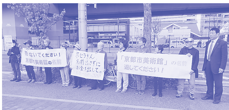
京セラ前での宣伝

暴挙」として切断撤回を求めました。また、美術館の再整備に当たって、美術団体の展示場所が確保されない問題も浮上。これら一連の問題で美術関係者、美術団体との共同が画期的に前進しました。