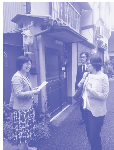
東山区での民泊実態調査