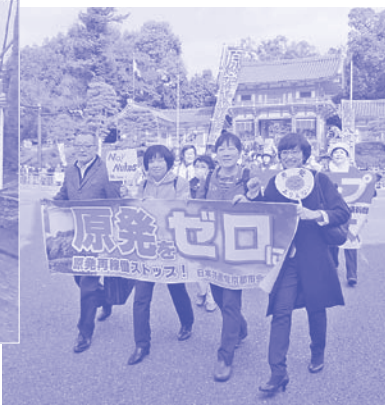
バイバイ原発京都集会参加の党議員