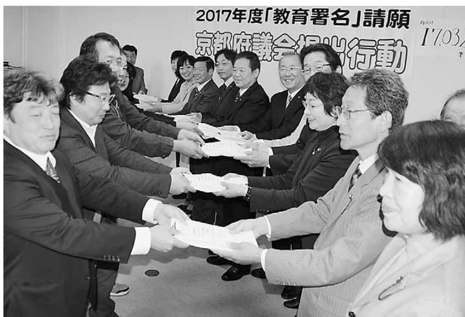
教育署名請願 約17000筆を府議会に提出 (2017年12月)

こうした取り組みが進む背景の一つには、ここ30年来続く教育大運動や私学助成を求める運動があります。教育大運動では毎年府議団は全員が請願署名の紹介議員となり採択に全力をあげ、署名累計4億6000万筆にもものぼっています。