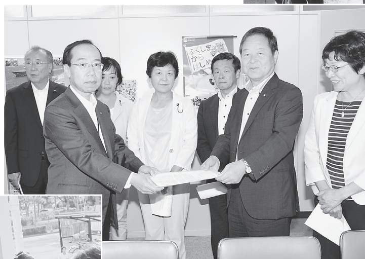
被害対策の申し入れ(2018年6月25日)