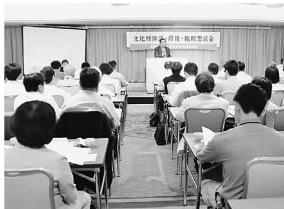
文化財保護・振興懇談会（2016年6月）

京都の町の切り売りという本質を明らかにし、京都府委員会、京都市議団とともに「民泊の京のまちづくり」シンポジウムを開催し、過大な誘客目標の見直し、必要な規制の強化などを求めています。 これまでつながりのなかった方や保守の皆さんとの共同にも努力してきました。本年4月から、国農政の抜本改悪が狙われるもとの、農業従事者や新規就農者との懇談を積み重ね、府独自の戸別所得補償の実施が8億円のできることを明らかにし、種子法を守るための条例の提案や農業と農村を守る府の役割発揮のための政策やピラを発行する等、持続可能な地域と集落づくりに全力を挙げてきました。林業分野でも、府がすすめるCRTに偏った支援策に対し、地場の中小林業関係者から悲鳴が寄せられ、議会でも厳しく追及する等、信頼が寄せられています。漁業でも定置網への支援策について、国政交渉も行う中、予算措置を勝ち取り大変喜ばれています。