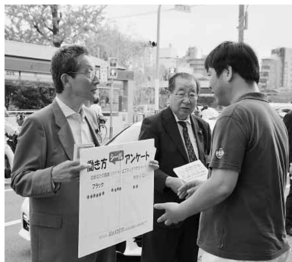
雇用問題のアンケート調査（2017年6月）

LDA-KYOTOの皆さんと給付制奨学金の実施や時給1500円実現を求める運動と論戦を積み重ねてきたことも、青年学生はもちろん、保護者や孫世代にも共感が広がり、大きな力となりました。私立高校授業料や通学費負担軽減の拡充、社会福祉施設サービス事業補助金の復活を含め、引き続き、緊急対策として実現を迫っていきます。