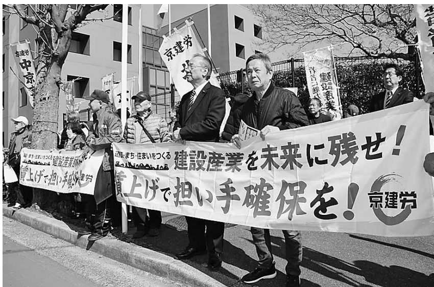
京建労府庁包囲行動（2018年2月）

党府議団はこうした闘いと連帯し、府発注の公共工事の現場調査を行うとともに、賃金条項を含む公契約条例の制定を重ねて迫っています。また、建設アスベスト訴訟の京都地裁判決で、建材メーカーの責任を認める画期的な勝利を勝ち取ったことも重要です。さらに、アスベスト含有成形板等の飛散防止へ府条例の強化を求めています。