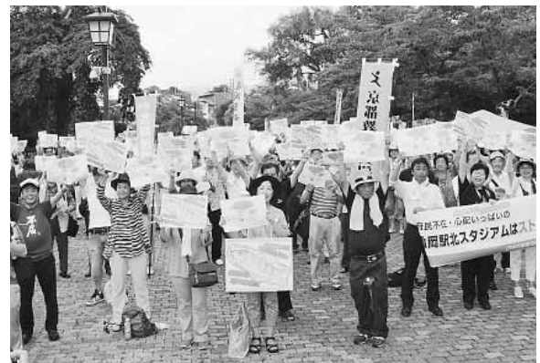
亀岡駅北にスタジアムはいらない府民大集会 (2017年7月)

12月には、スタジアム本体工事契約が提出され、緊急に府民的請願を呼び掛けわずか数日で268件もの請願が府議会に寄せられ、緊急昼休み抗議宣伝なども取り組まれました。京都府知事選挙の出口調査では、京都スタジアムについて「計画通り進めるべき」32.6%にとどまり、「見直すべき」33.8%と上回るなど、立ち止まって検証することが必要です。