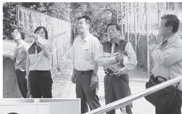
大山崎小学校の窓ガラスが割れた体育館を調査