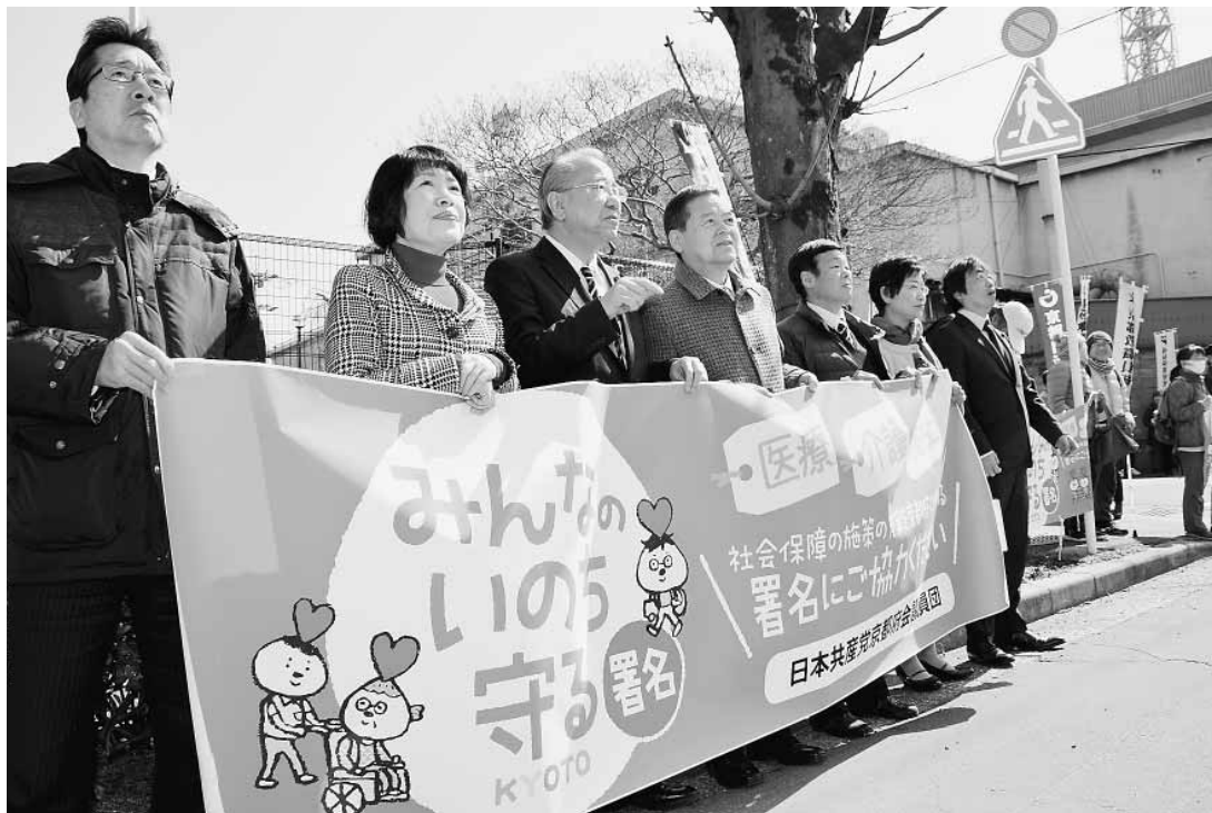
みんなのいのちを守る署名の推進（2018年2月）

来春4月に迫った統一地方選挙では、議席回復をめざす伏見区、長岡京市・乙訓郡区、また右京区での現有複数議席の絶対確保、二人区でさらに新しい議席を獲得するなど、15議席（議席占有率25%）を突破し、自民党の議席を減らし、史上最高の議席獲得に全力をあげます。