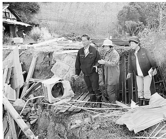
南山城村台風被害調査（2017年10月）

す。こうした活動には、他党派議員からも、「どこへ行っても共産党が先に来ている、と地元の人から叱られる」との声が寄せられています。雪害に対するパイプハウスの再建支援などが実現し、また台風被害支援策でも、これらの内容を知らせるリーフレットを作成し、市町村議員団の皆さんと届けたことも喜ばれました。