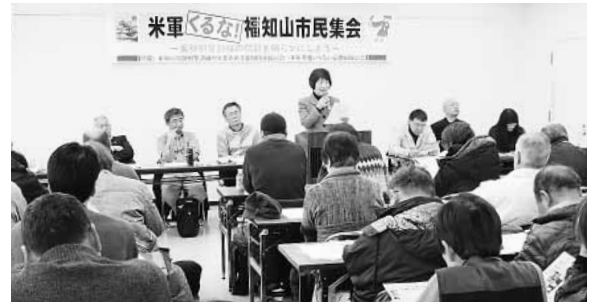
米軍基地くるな福知山集会（2017年1月）

安倍政権は憲法改悪に執念を燃やしています。しかし3000万署名をはじめ、府民的世論は大きく広がっています。しかも、南北首脳会談