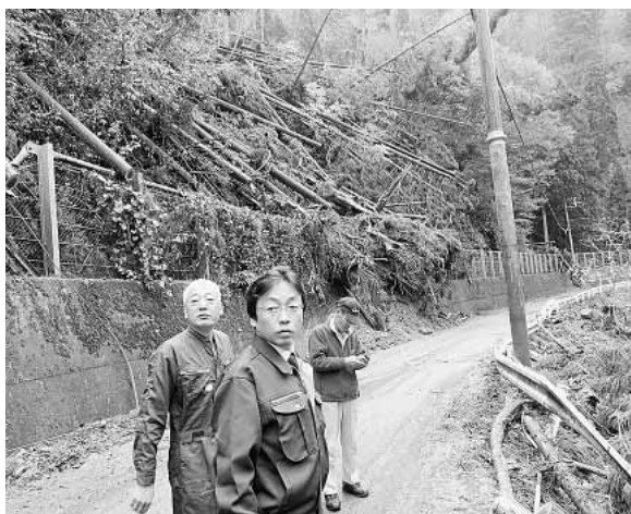
美山市台風被害調査（2017年11月）

また、昨年秋の台風18号、21号は、府域全体に深刻な被害をもたらし、わが党議員は市町村議員団・国会議員と連携し現地調査を行い、申し入れをする中、初めて漁網への支援策が盛り込まれることとなりました。これらは国会で支援制度や財源確保を求める論戦と結んだ成果で