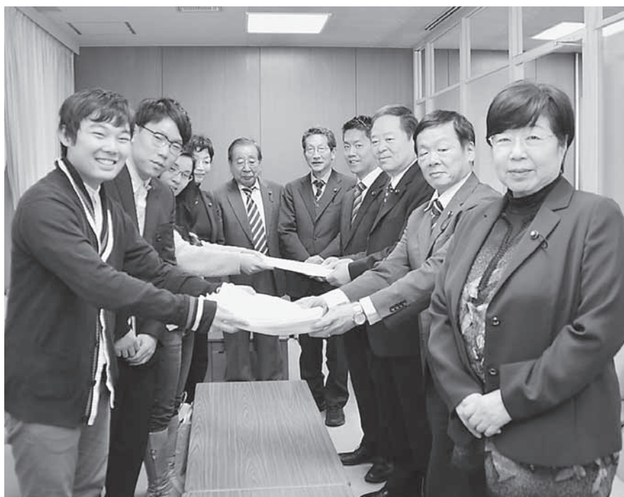
学費奨学金の負担軽減と若者の雇用改善を求める請願要請（2018年2月）