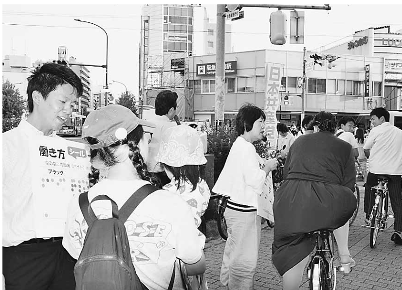
働き方なんでも相談会にとりくむ(2017年7月)

これらに、消費税率の引き上げや医療・介護の負担増が追い打ちをかけています。その結果、2016年度の府税収入は、当初見込みから約200億円も落ち込んでいます。それだけに、社会保障の充実と雇用・中小企業支援、街づくりを一体的・総合的にすすめることが、今ほど求められている時はありません。