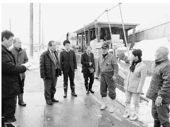
福知山市大雪被害調査（2017年1月）

2017年1月から2月にかけて2度にわたる大雪により、1200棟を超えるビニールハウス・茶棚が被害を受けるなど、農林業を中心に甚大な被害が発生しました。党府議団は、市町の議員団・国会議員と協力し、計5回にわたる現地調査を実施し、京丹波町長とも懇談し、農家の皆さんから寄せられた要望をまとめ、京都府や近畿農政局に申し入れ議会で実現を迫りました。