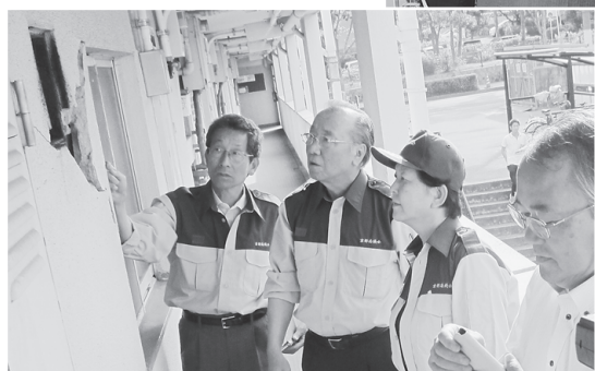
八幡市府営住宅の被害状況を調査